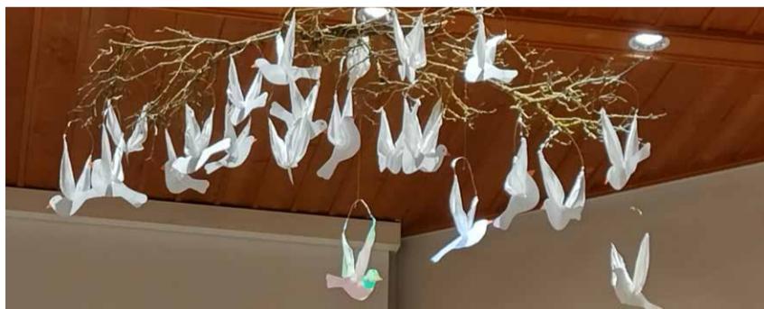
Pfingstlich – im März 2024 durch KUV 4./ 5. Klassen erstellt und in der Kirche zum Fliegen gebracht.

Segnung 24. März Noé Rolli, Falkenfluhweg 15, Wichtrach