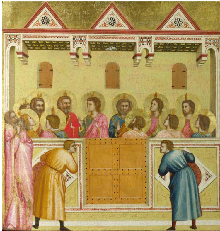
Giotto di Bondone, Florenz (1267–1337) Pfingsten